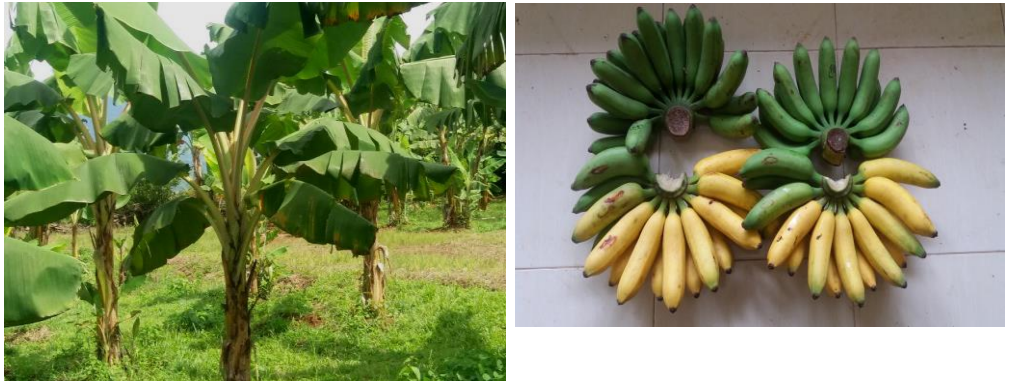
Gambar 1. Keragaan calon VUB pisang FHIA25